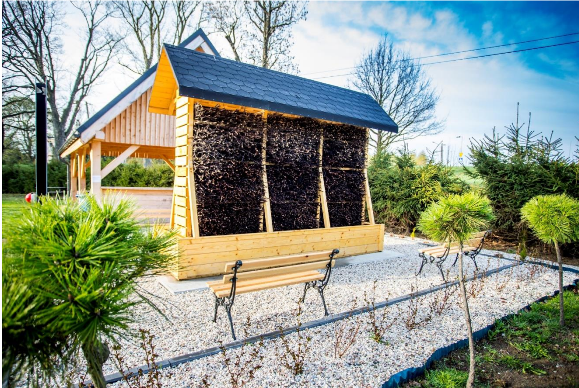
Tężnia solankowa w Miskowicach Stowarzyszenie "Miskowice Dolina Żółtej"